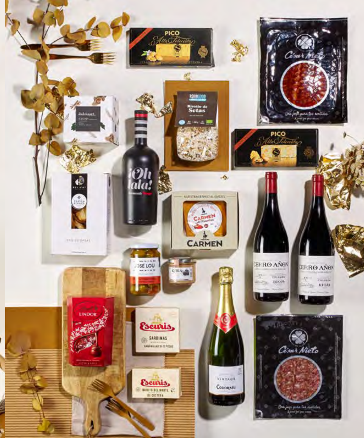
Lote The Exquisite Box 312 REF. 2D2CTEB312 · 61,40€ 69,91€ IVA INC.