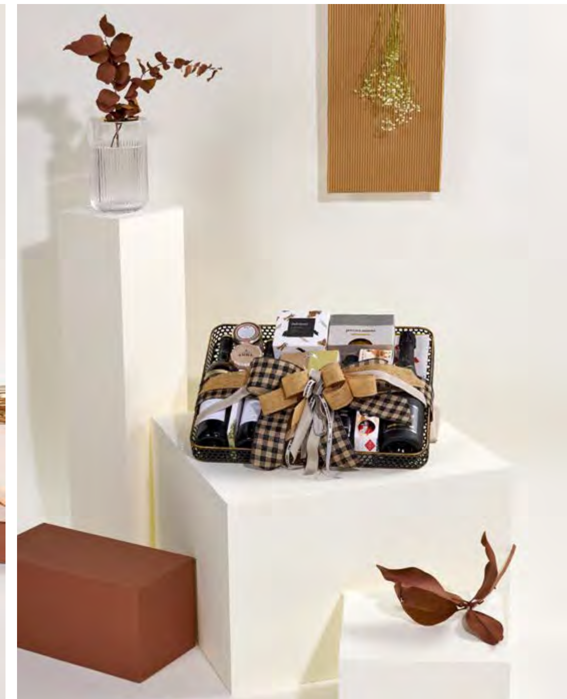
Bandeja The Exquisite Box 319 REF. 2D2CTEB319 · 49,39€ 56,84€ IVA INC.