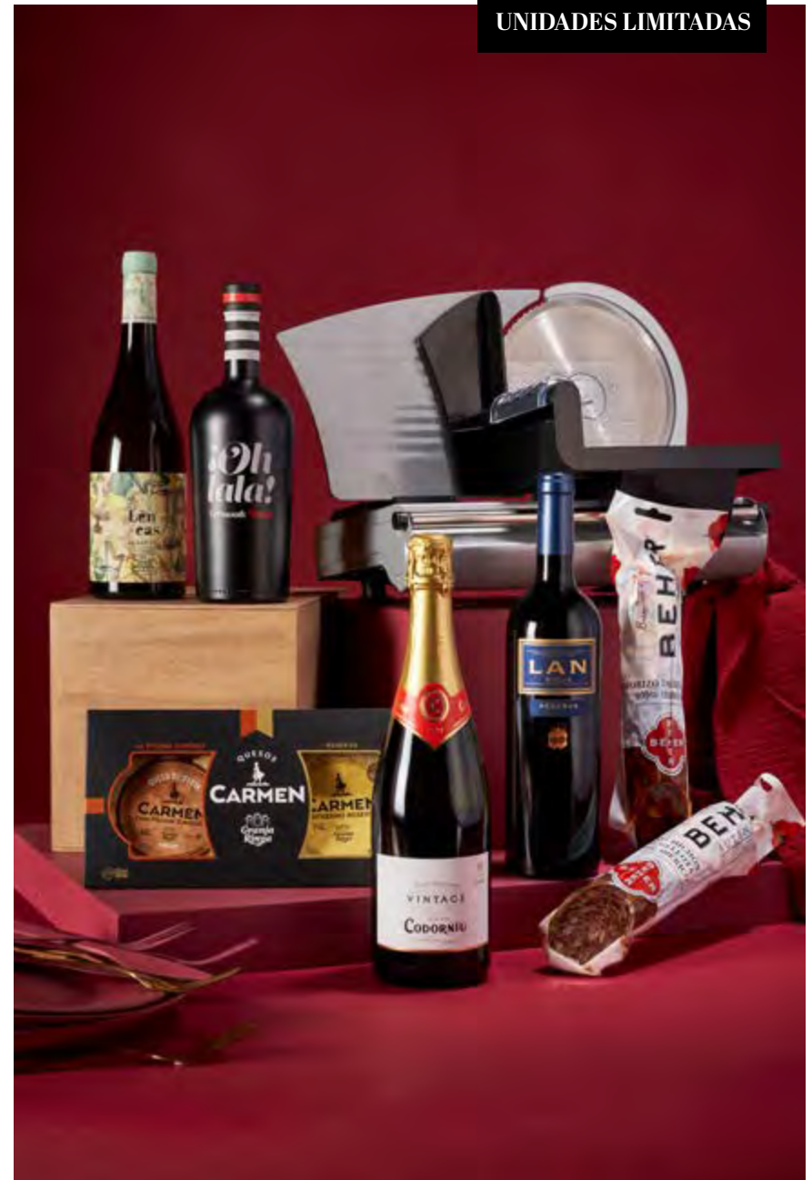
REF. 2D2C117R _ Estuche Regalo 117R · 97,03€ 114,38€ IVA INC.