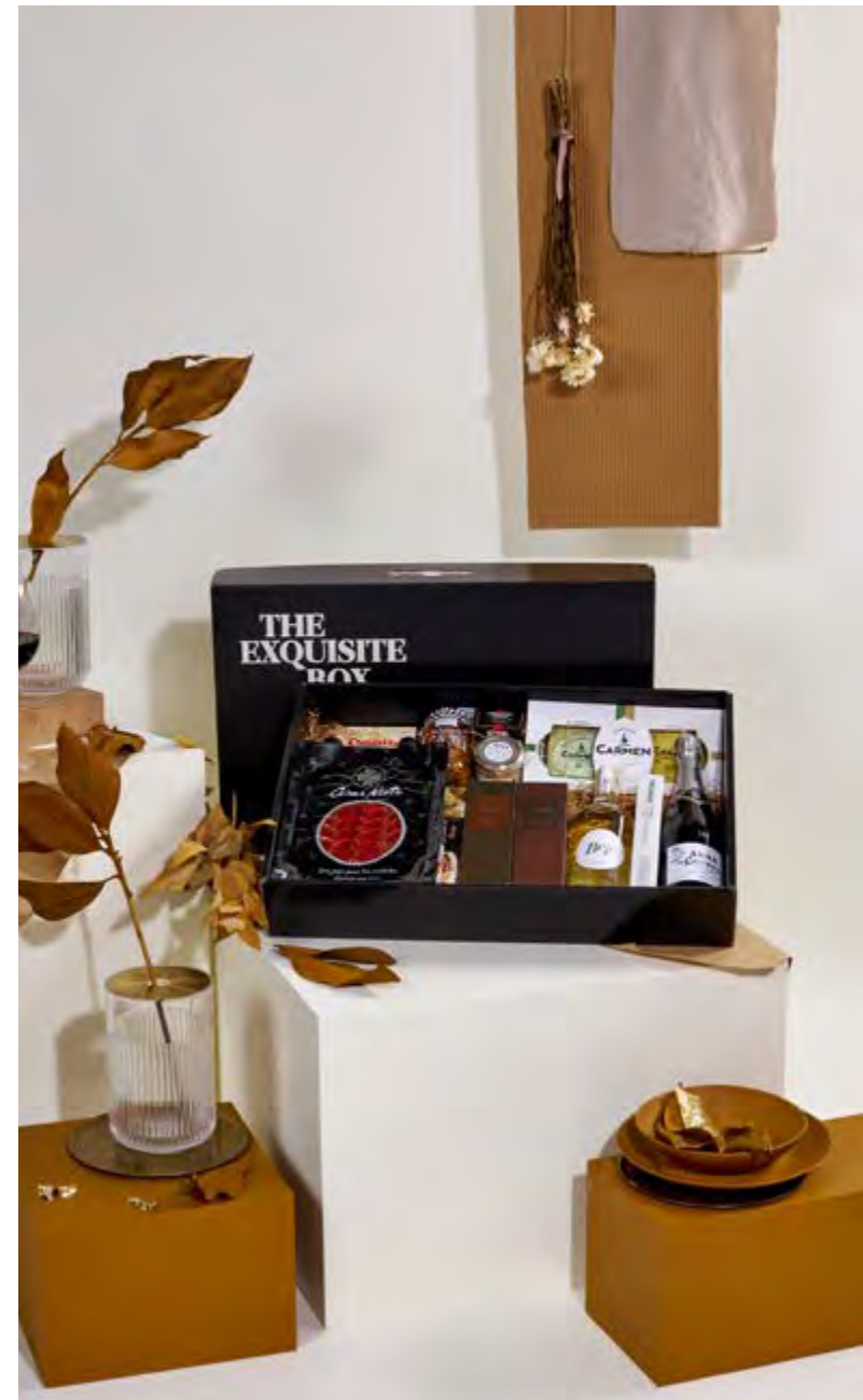
Lote The Exquisite Box 306 REF. 2D2CTEB306 · 84,69€ 95,92€ IVA INC.