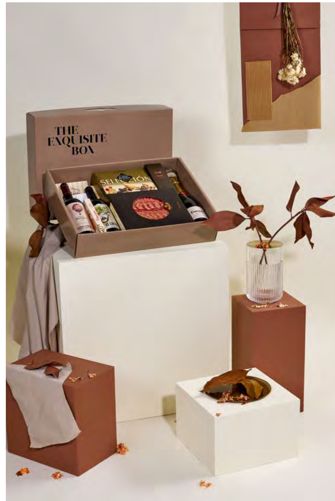
Lote The Exquisite Box 309 REF. 2D2CTEB309 · 68,89€ 77,24€ IVA INC.