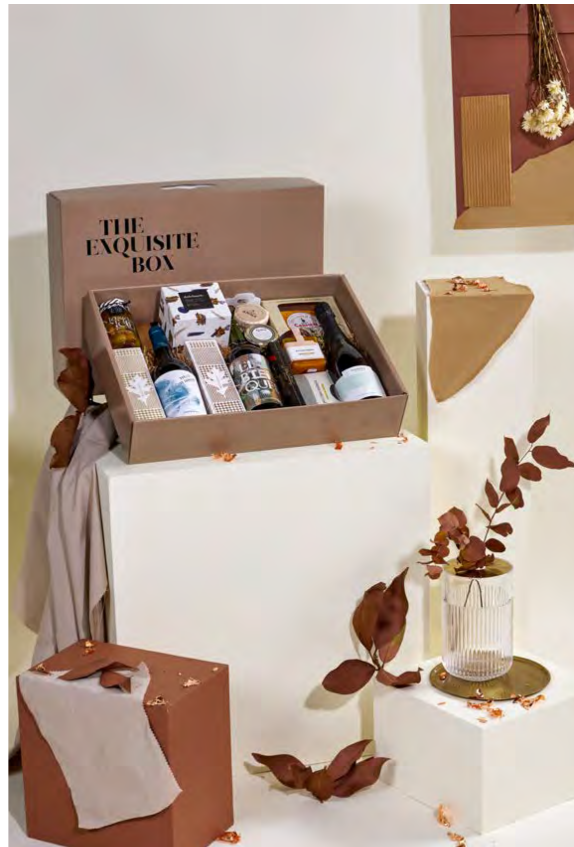
Lote The Exquisite Box 320 REF. 2D2CTEB320 · 47,43€ 54,01€ IVA INC.