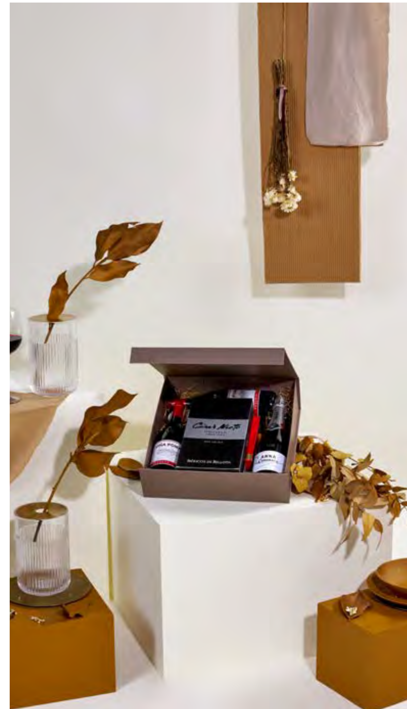
Caja Lujo The Exquisite Box 308 REF. 2D2CTEB308 · 74,21€ 84,39€ IVA INC.