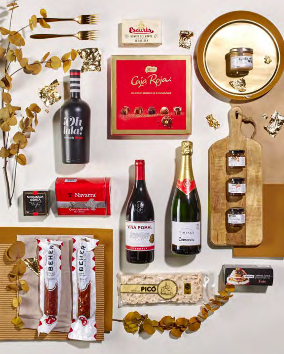
Cesta The Exquisite Box 311 REF. 2D2CTEB311 · 62,18€ 71,64€ IVA INC.