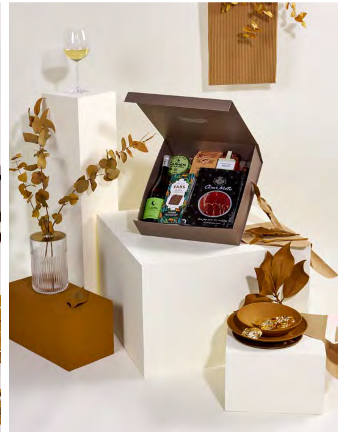
Caja Lujo The Exquisite Box 310 REF. 2D2CTEB310 · 64,09€ 71,85€ IVA INC.