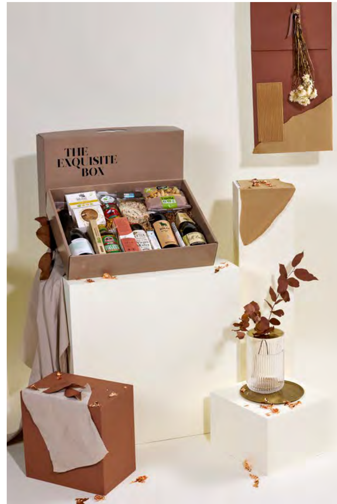
Lote The Exquisite Box 314 ECOLÓGICO REF. 2D2CTEB314 · 58,27€ 65,74€ IVA INC.