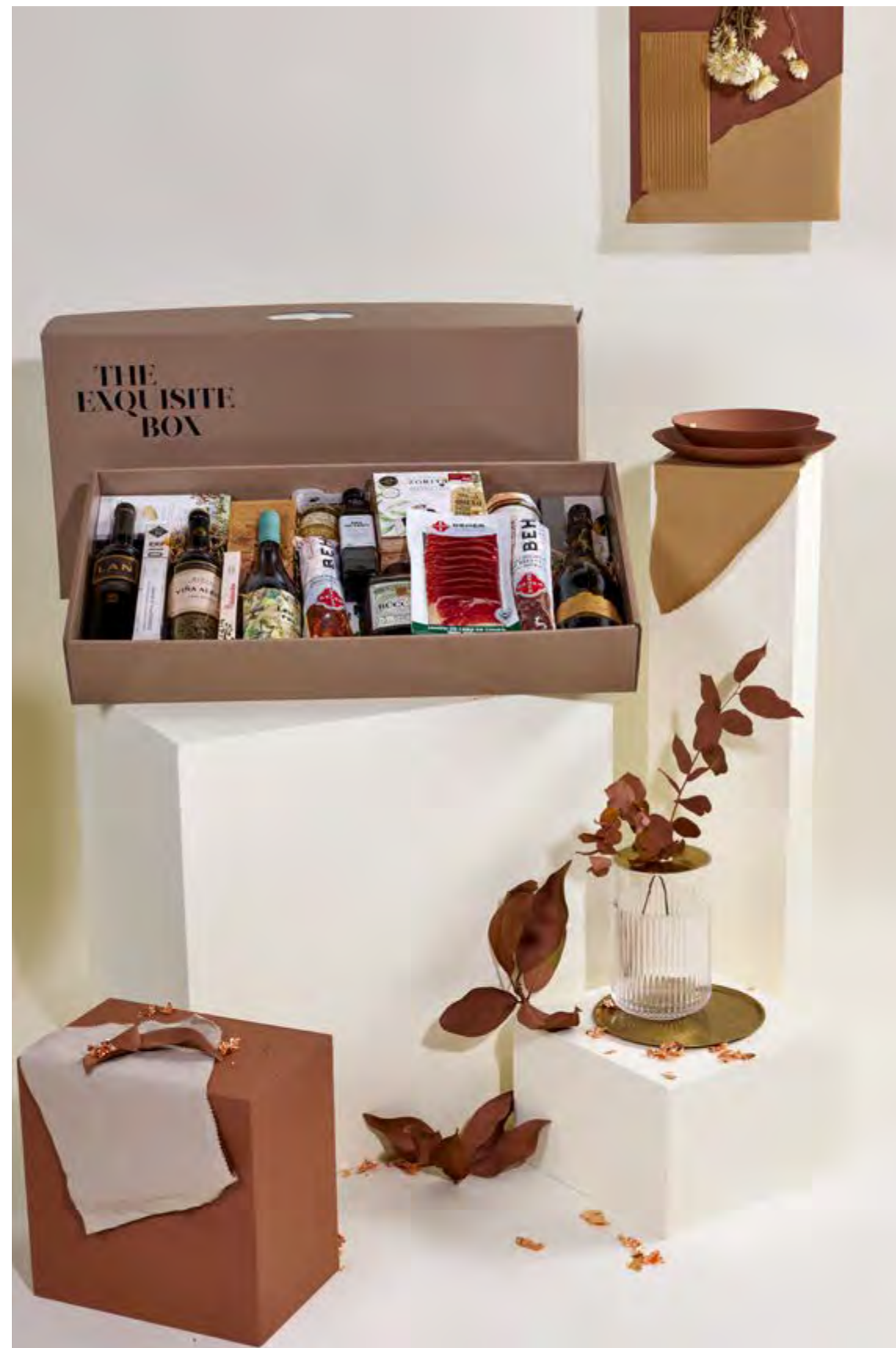
Lote The Exquisite Box 304 REF. 2D2CTEB304 · 128,27€ 145,45€ IVA INC.