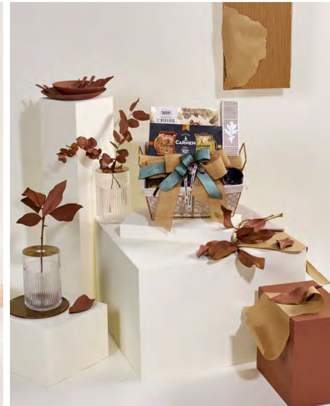
Cesta The Exquisite Box 317 REF. 2D2CTEB317 · 52,65€ 60,58€ IVA INC.