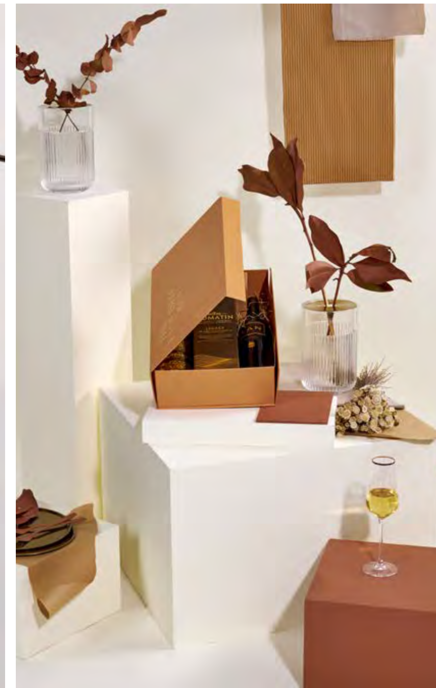
Incluye caja plegable lujo decorada