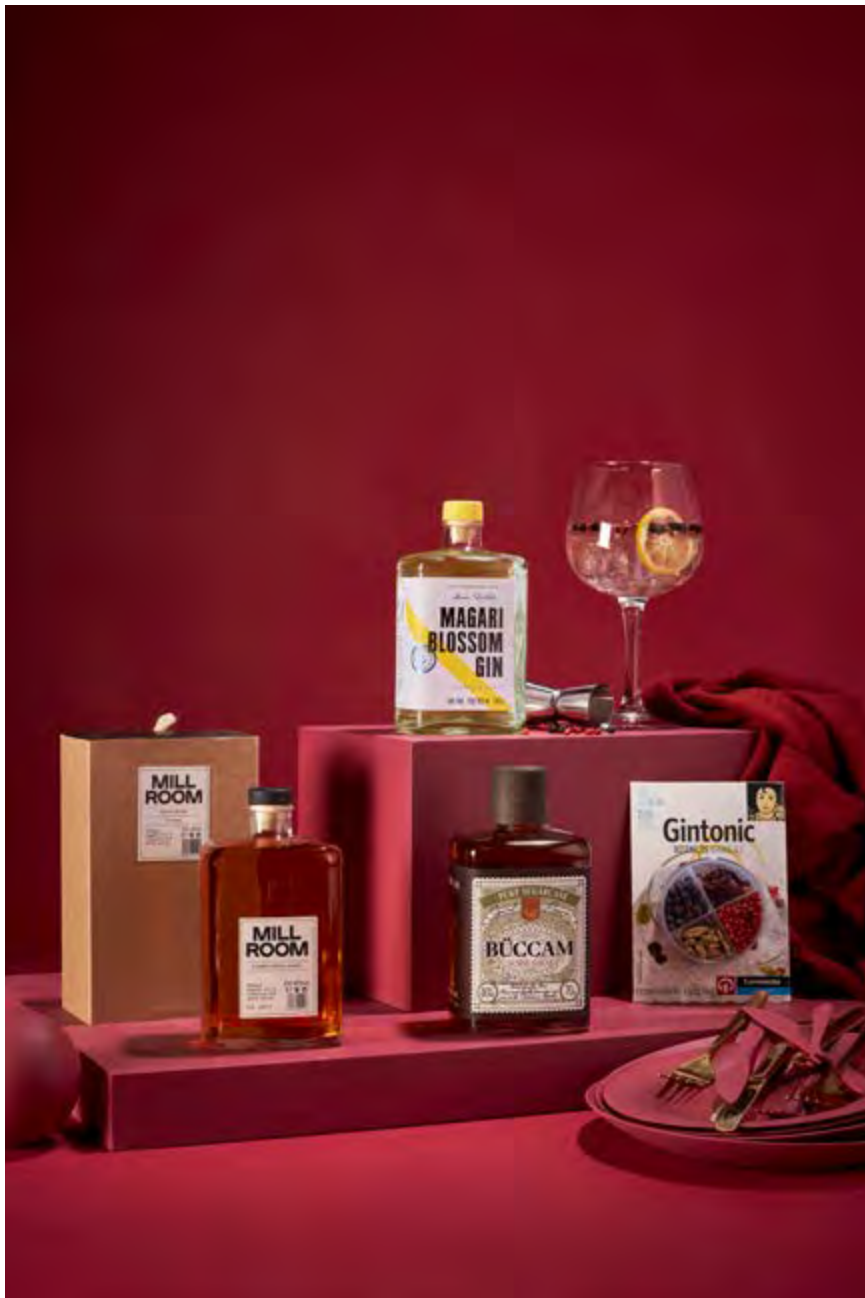
REF. 2D2C116R _ Estuche Regalo 116R · 56,48€ 67,95€ IVA INC.