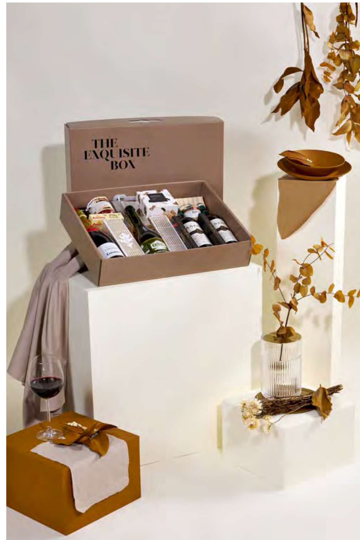
Lote The Exquisite Box 318 REF. 2D2CTEB318 · 49,50€ 56,15€ IVA INC.