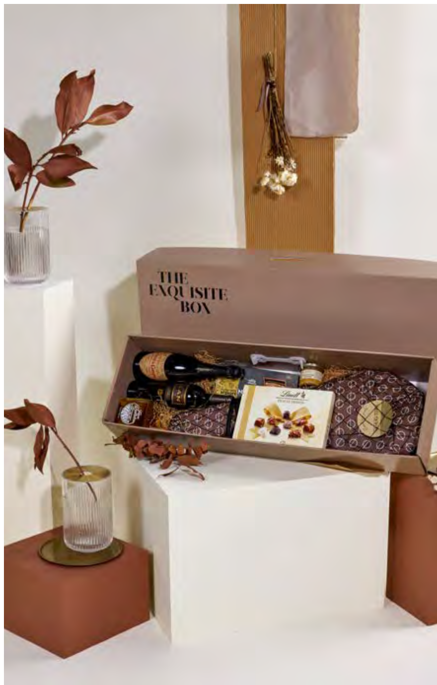
Jamonero The Exquisite Box 305 REF. 2D2CTEB305 · 121,82€ 136,36€ IVA INC.