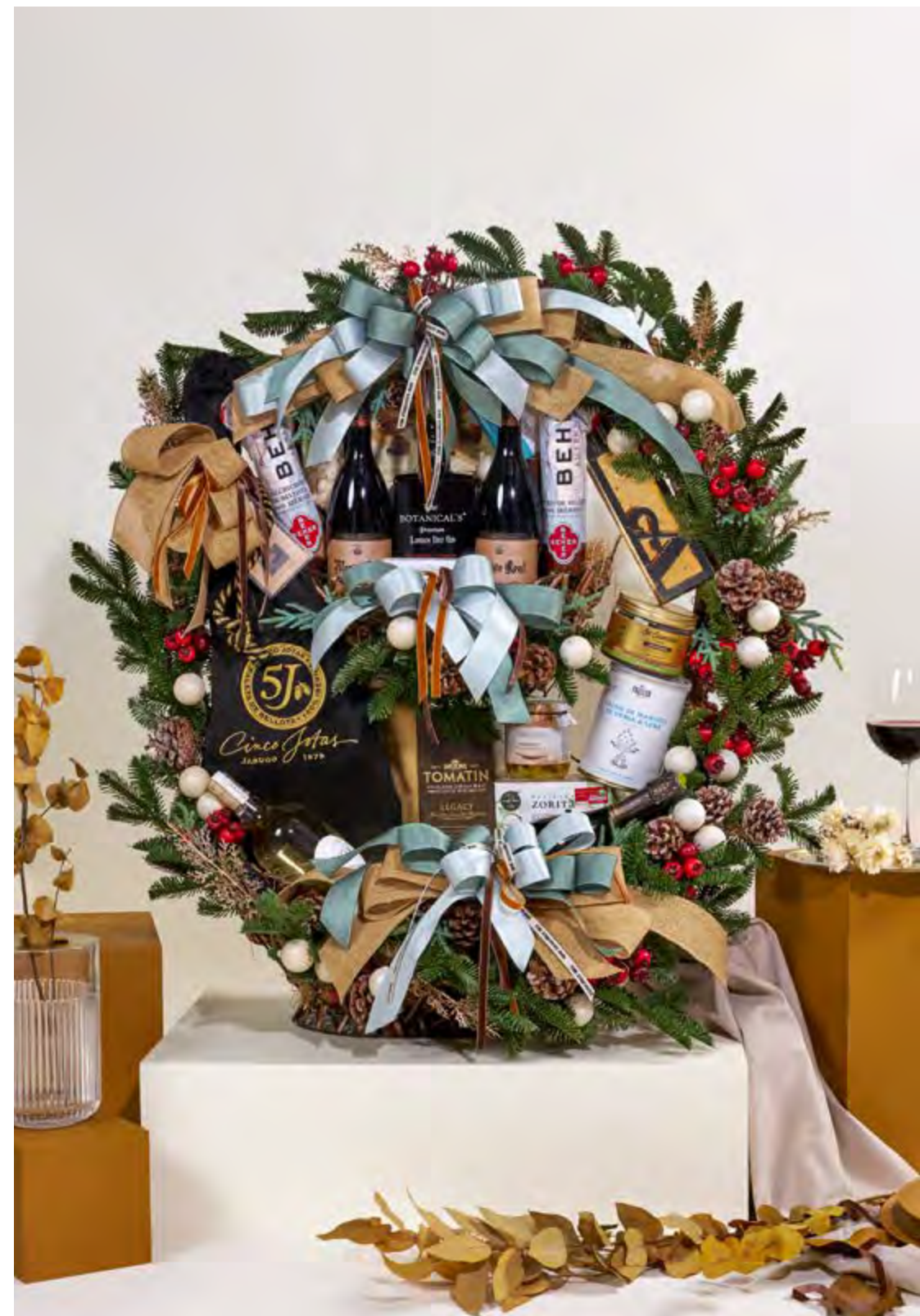
Cesta The Exquisite Box 302 REF. 2D2CTEB302 · 442,53€ 503,41€ IVA INC.