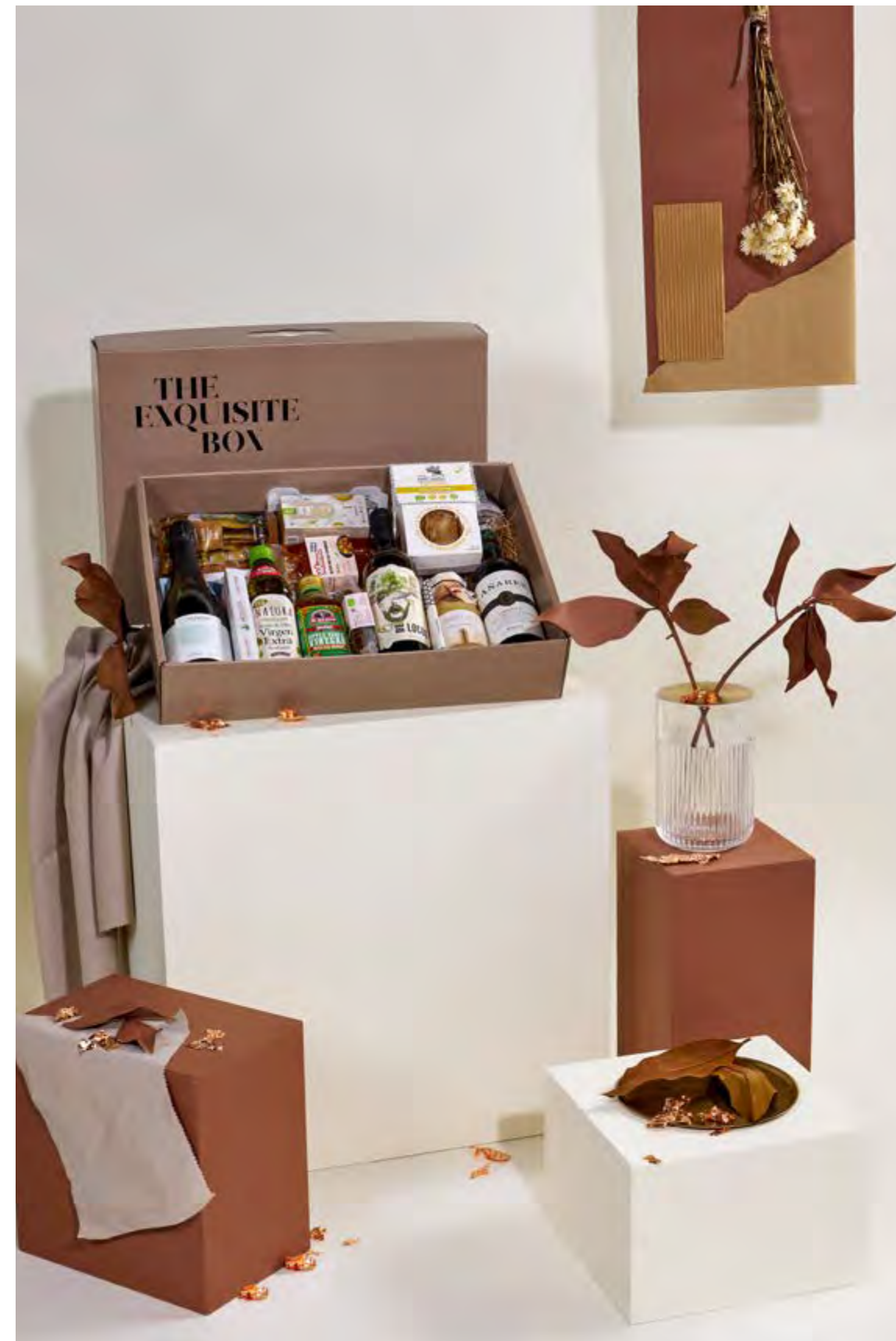
Lote The Exquisite Box 315 VEGANO REF. 2D2CTEB315 · 58,13€ 65,93€ IVA INC.