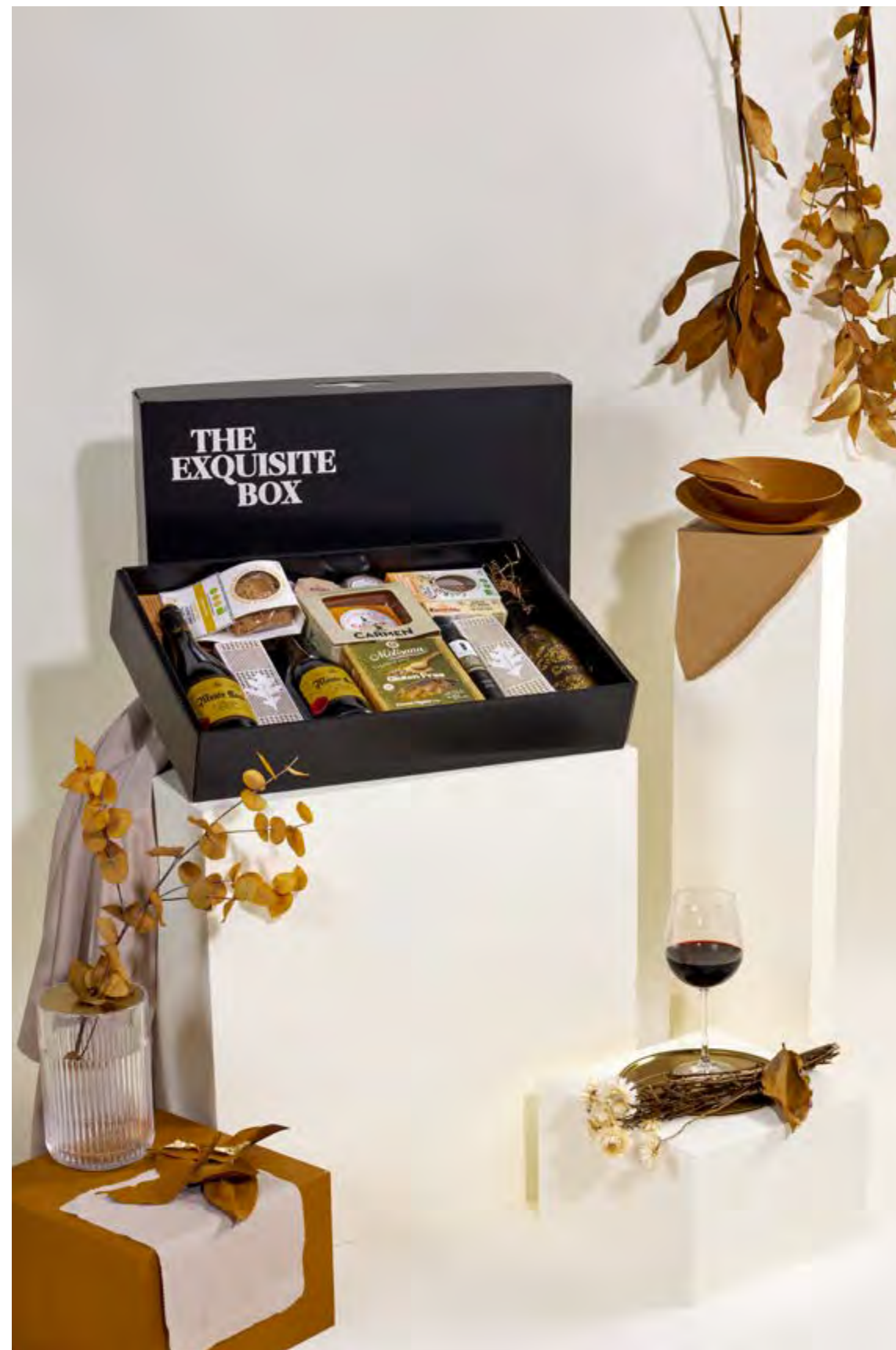
Lote The Exquisite Box 313 APTO CELÍACOS REF. 2D2CTEB313 · 59,36€ 67,12€ IVA INC.